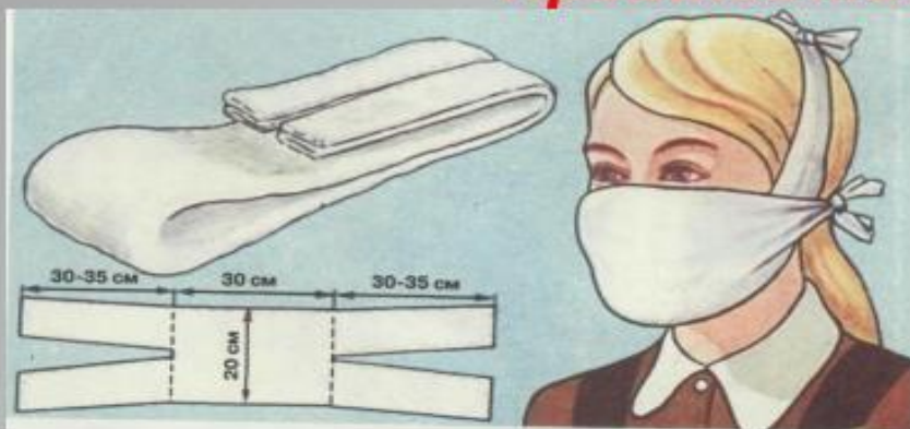
Ватно-марлевая повязка ВМП-1