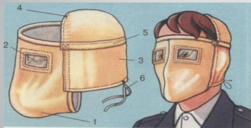
Противопыльная тканевая маска ПТМ-1